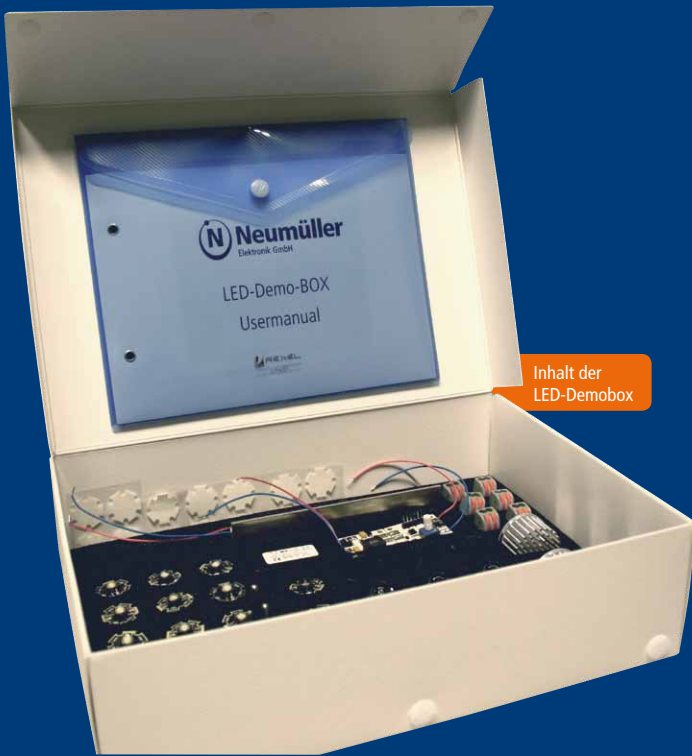
Inhalt der LED-Demobox