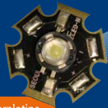
LED auf Starplatine