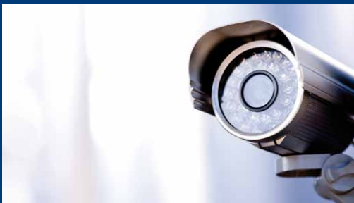
IR-Ring für Kameraanwendungen